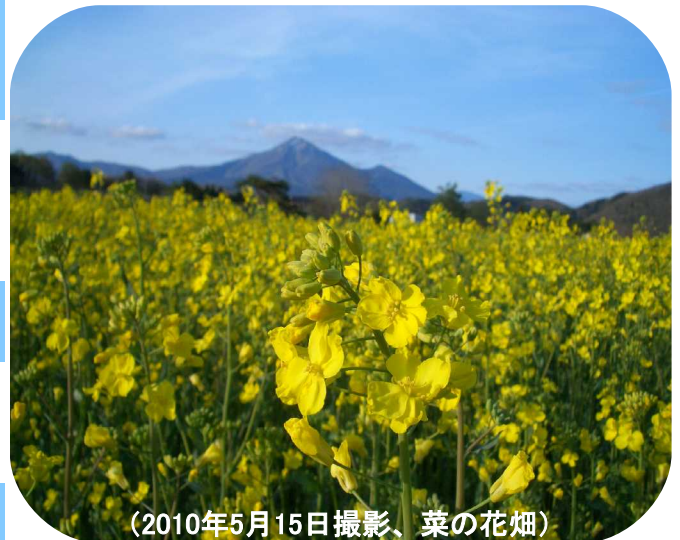
(2010年5月15日撮影、菜の花畑)